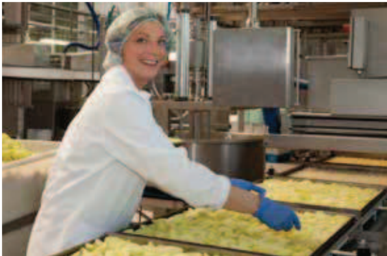
e FOTO session